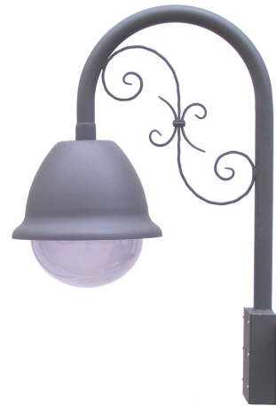
CSI250+STA250 -old style-